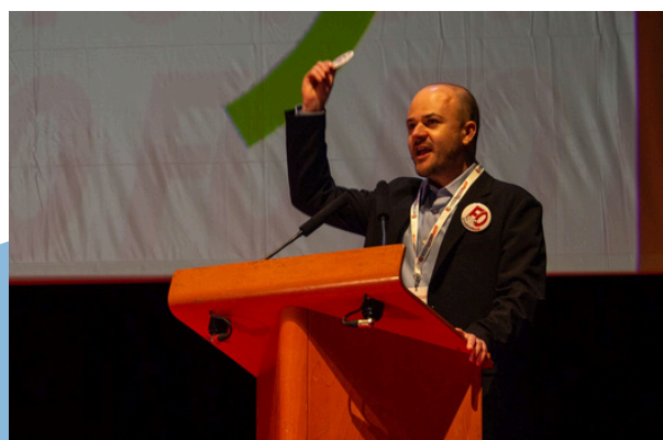
Intervention de la FGCEN en tribune