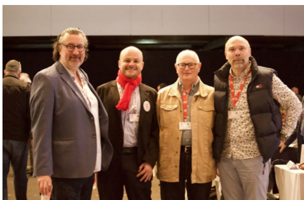
La délégation FGCEN

👉 Une prise de position forte, qui inscrit pleinement la défense de la CRPCEN et des régimes spéciaux dans les orientations confédérales.